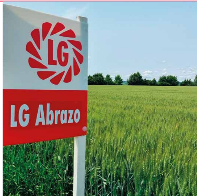
Vyrovnaný, zapojený, nepofahnutý porast bez rastlín odchylného typu,“ stálo v protokoloch z oboch povinných prehliadok množiteľského porastu